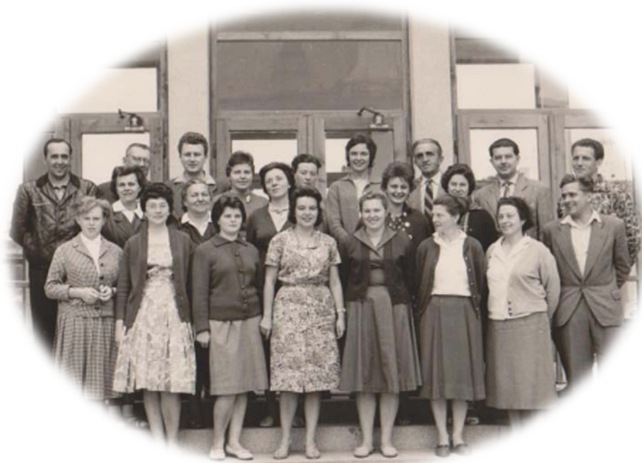
...učitelský sbor 1961 / 2011...